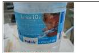
1リットル for 10リットル Volvicを12買うとアフリカに10人の水が供給されるって！ ユニセフの共同開発で生まれたらしい それを知って、ますます好きでVolvic買ってますから〜 みなさんも、ぜひぜひVolvicを！！