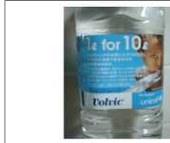
偶然購入したのを聞いてもらったので箱買いしてみました。 (このあたり1日3リットルはほぼ恒常的です)