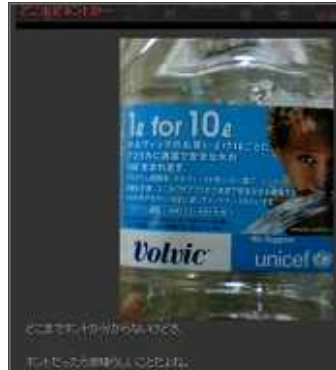
これまで作がなかった これにこそが本当の価値

ここで実際に5月と7月の生ブログに目を通して見よう。 まず5月のピークは、 新製品ボルヴィックフルーツキス が発売されたその反響である。これに日用品の流行に敏感な10代が飛びついたという構図が見える。